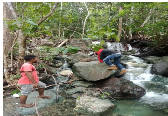
Gambar 7. Aliran Air Terjun di Desa Yeisowo

Sesuai dengan hasil tinjauan ke lapangan dan wawancara dengan warga desa setempat bahwa sumber air yang mengalir ke desa Yeisowo berasal dari air terjun yang berada di daerah perbukitan. Area perbukitan ini sendiri sangat sulit untuk di jangkau karna memiliki medan yang sangat tinggi, terjal dan jauh. Untuk mencapai puncak lokasi calon Pembangkit Listrik Tenaga Micro Hydro dibutuhkan waktu tempuh kurang lebih 1 jam. Menurut warga setempat Air terjun yang mengalir ke desa Yeisowo ini tidak pernah habis dan menjadi salah satu sumber air minum bagi warga sekitar.