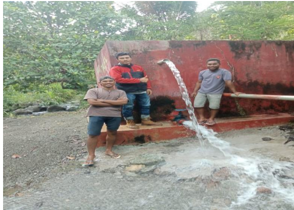
Gambar 8. Bak Penampungan Air Desa Yeisowo Pengukuran Kecepatan Air

Besarnya sumber air yang mengalir ke desa Yeisowo belum dimanfaatkan dengan baik oleh warga sekitar dimana air yang mengalir hanya di gunakan sebagai sumber air minum bahkan penampungan dan pengairan ke rumah-rumahpun masih menggunakan sarana yang sangat sederhana yaitu dengan menggunakan pipa dari bak penampungan menuju wadah penampungan dan bambu yang dialirkan ke rumah-rumah penduduk. Terdapat 1 buah reservoir yang tersedia dengan kapasitas penampungan yang sangat besar