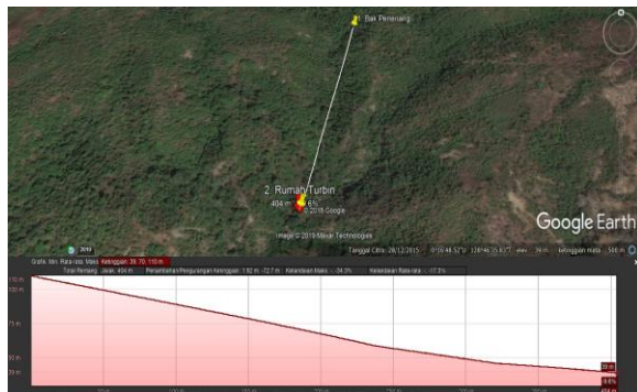
Gambar 6. Lokasi PLTMH Kincir Air Desa Yeisowo

Survei potensi air dilakukan di desa Yeisowo Kecamatan Patani Kabupaten Halmahera Tengah. Lokasi ini terletak di atas air terjun yang berada pada desa tersebut. Letak tempat tersebut pada penggalan peta Kabupaten Halmahera Tengah yang terlihat di Gambar 6. Calon PLTMH Kincir Air ini rencananya akan dibangun dengan memanfaatkan potensi aliran air di atas air terjun tersebut.