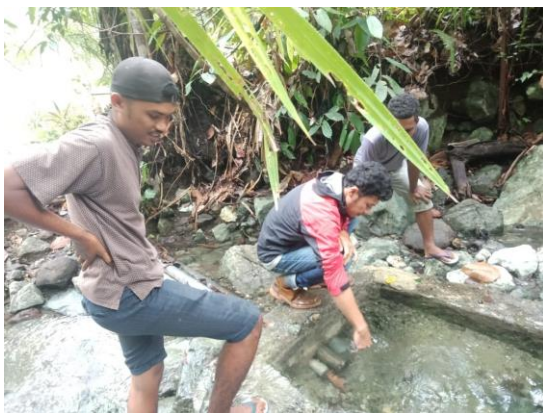
Gambar 9. Wadah Penampungan Air Desa Yeisowo

Dari hasil tinjauan terdapat pula wadah penampungan air yang dibuat oleh warga desa dan merupakan bak penampung induk yang berada di bagian perbukitan serta tidak jauh dari reservoir sehingga dengan adanya wadah ini sangat membantu peneliti untuk mengukur kecepatan air.