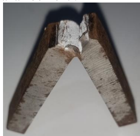
Gambar 6. Foto makro dari spesimen uji impact base metal

Dari hasil pengujian yang dilakukan perpatahan pada spesimen uji impact base metal adalah patah ulet. Patah ulet merupakan patah yang diakibatkan oleh beban statis yang diberikan pada material, jika beban dihilangkan maka penjarangan retakan berhenti.