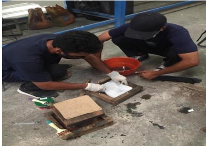
Gambar 1. Proses mencetak komposit

kemudian lakukan pengepresan/pemberian beban agar tidak terjadi penggelembungan udara yang mengakibatkan penurunan kekuatan sifat-sifat mekanis. Proses selanjutnya, membiarkan lembaran material komposit mengeras didalam cetakan pada temperature ruang selama 12 jam.