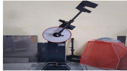
Gambar 3. Proses uji impact