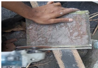
Gambar 2. Proses pembentukan spesimen uji

Memotong komposit menggunakan gerinda potong sesuai bentuk dan ukuran standar uji impact ASTM D256. setelah itu dilakukan pengujian impact, dan dilakuka serangkaian pengamatan ketangguhan komposit.