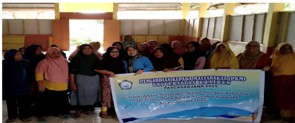
Gambar 1. Kegiatan Pendampingan Literasi Investasi baku pot di desa Guraping