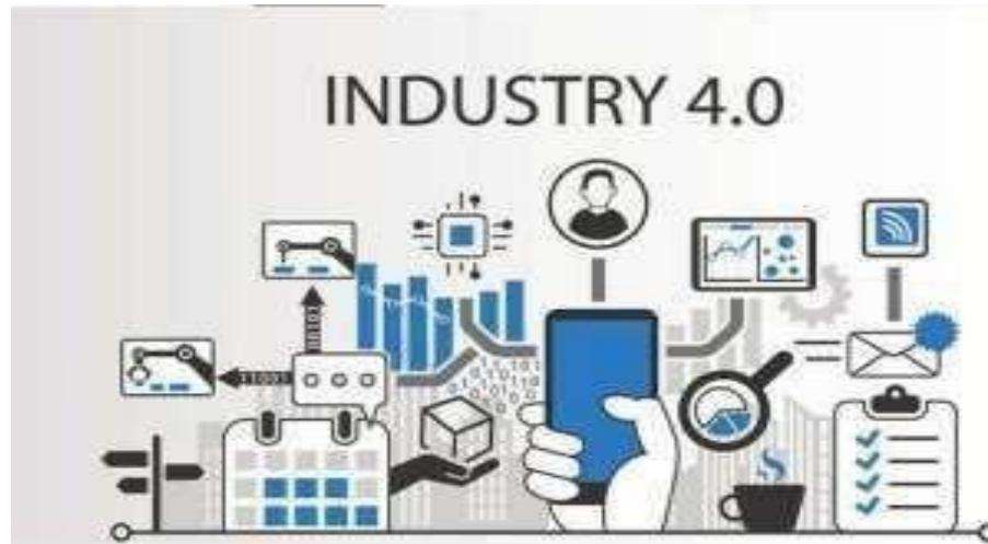
Revolusi Industri 4.0.

Industri 4.0 di bidang pariwisata menekankan pada Tourism and The Digital Transformation atau Pariwisata dan Transformasi Digital. Pada jurnal ini akan membahas mengenai pemanfaatan digital marketing bidang pariwisata di Bali yang dilatar belakangi oleh industri 4.0 dan perilaku generasi Y dan Z.