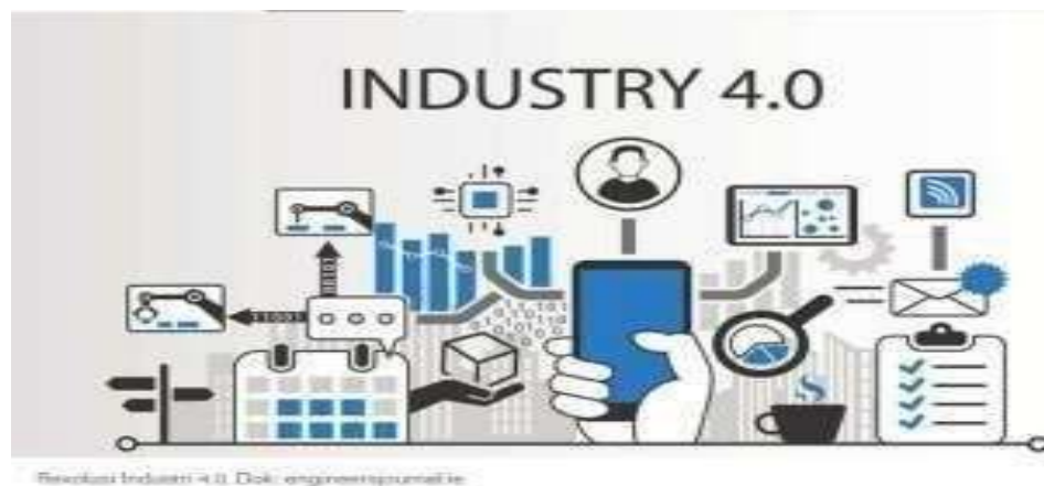
Gambar 2. Industri 4.0

Industri 4.0 di bidang pariwisata menekankan pada Tourism and The Digital Transformation atau Pariwisata dan Transformasi Digital. Pada jurnal ini akan membahas mengenai pemanfaatan digital marketing bidang pariwisata di Bali yang dilatar belakangi oleh industri 4.0 dan perilaku generasi Y dan Z.