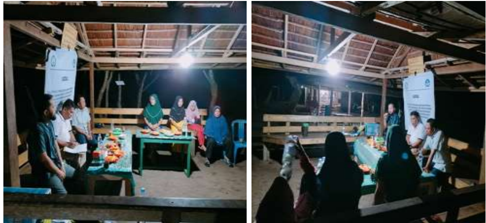
Gambar 1. FGD dengan Masyarakat Desa Lako Akelamo

Pelatihan literasi yang dimasud disini adalah bgaimana para ibu-ibu dan peran pemuda karang taruna dapat mehami fungsi gedjed atau hp untuk mempromosi secara langsung baik tempat, wisata dan menu makanan yang tersedia dalam lokasi tempat wisata. Inilah yang penting bagaimana peran ini dapat difungsikan dalam masyarakat yang betempat tinggal didekat lokasi wisata. Bagi pemuda karang taruna atau pemuda yang mempolori tempat wisata tentu memahami lokasi strategis yang bisa dimanfaatkan bagi semua toris yang datang ini mulai dari tempat parkir, tagi karcis masuk, Tempat ganti pakian saat mandi, Wc, Musalah, Kasebo dan lain -lain inilah yang menjadi penting.