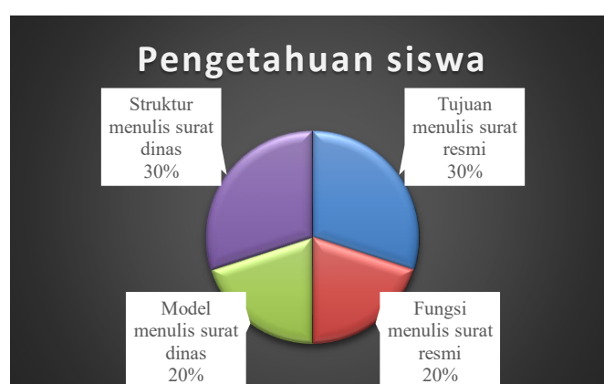
Gambar 1. Persentase pengetahuan kemampuan menulis siswa

Hasil uji pengetahuan siswa pada konsep menulis surat resmi (dinas) menunjukkan bahwa kemampuan siswa dalam menulis struktur surat dinas sebanyak 30%, mengetahui tujuan menulis surat resmi sebanyak 30%, model menulis surat resmi sebanyak 20%, dan fungsi menulis surat resmi sebanyak 20%.