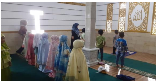
Gambar 1. Dokumentasi Kegiatan Pelaksanaan Salat Duha