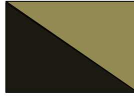
dua buah segitiga