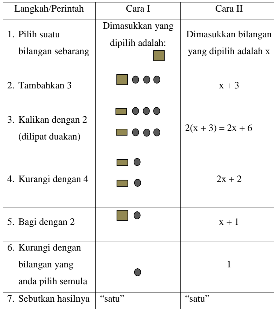
Tabel 1. Contoh Pembuktian Secara Deduktif

Jelaslah bahwa jika pada pembuktian secara induktif digunakan bilangan-bilangan dari anggota semestanya, maka pada pembuktian secara deduktif, langkah pertamanya adalah memisalkan bilangan yang dipilih dengan variabel x ataupun persegi yang dapat diganti untuk mewakili setiap anggota semestanya. Melalui cara seperti ini, jika memang benar bahwa hasil terakhirnya adalah 1 maka dapat disimpulkan bahwa hasil terakhir berupa bilangan 1 tersebut akan berlaku untuk semua bilangan sembarang pada semesta pembicaraannya. Dengan mengikuti ketujuh langkah yang ditentukan, ternyata hasilnya 1, dapat disimpulkan bahwa untuk semua bilangan sembarang yang dipilih, termasuk bilangan negatif, pecahan, dan bentuk akar, hasilnya akan selalu 1.