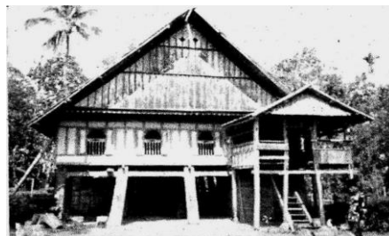
Gambar: Rumah Tradisional Makassar

pertanian atau penangkap ikan atau dijadikan kandang ayam, itik, kambing atau ternak lainnya seperti kuda. Saat ini berfungsi sebagai tempat kendaraan roda dua dan semacamnya.