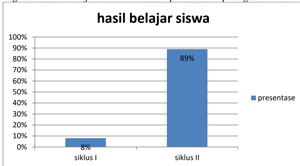
Gambar 4.3 Grafik Hasil Belajar Siswa Pada Siklus I Dan Siklus II

Hasil belajar siklus I dan siklus II meningkat setelah setelah pembelajaran dengan penerapan model pembelajaran example non example untuk meningkatkan hasil belajar siswa hal ini dapat kita lihat pada grafik berikut ini.