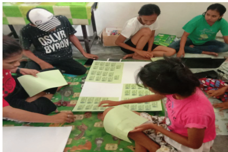
Gambar 5. Kegiatan Proses Pembuatan Stiker