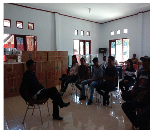
Gambar 3. Pertemuan tim dengan Mitra

bahwa masyarakat Hatu masih sangat minim pengetahuan tentang apa itu virus Corona dan cara pencegahan penularannya. Selanjutnya tim melakukan pertemuan dengan mitra untuk mencari solusi dari permasalahan tersebut (gambar 3).