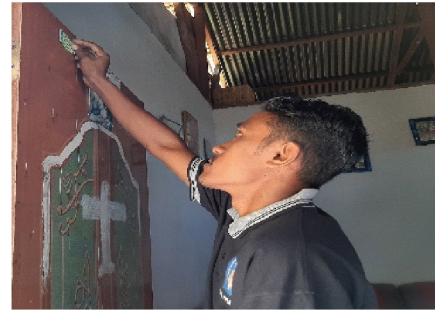
Gambar 7. Penempelan stiker di pintu masyarakat sebagai pertanda kegiatan sosialisasi telah selesai

Ucapan terima kasih disampaikan kepada LPM UKIM yang telah mendanai dan memfasilitasi kegiatan pengabdian ini. Ucapan terima kasih juga disampaikan kepada mitra Pemerintah Negeri Hatu yang telah bersedia bekerja sama demi suksesnya pelaksanaan kegiatan ini.