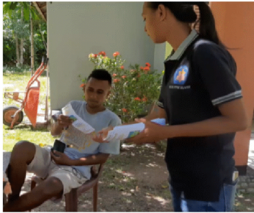
Gambar 6. Pembagian Leaflet kerumah masyarakat Negeri Hatu

Luaran yang dihasilkan dari kegiatan ini terbilang sangat memuaskan dikarenakan antusias masyarakat Negeri Hatu pada saat menerima tim membagikan leaflet virus Corona, terlihat dari rata-rata