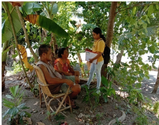
Gambar 2. Wawancara tim dengan Masyarakat Negeri Hatu

masyarakat Hatu agar dapat dicegah penularannya [5]–[8][9]–[11]. Pengamatan dan wawancara awal telah dilakukan oleh tim KKN PPM kepada masyarakat untuk mengetahui sejauh mana pengetahuan masyarakat tentang penyakit virus corona hal ini Dari hasil wawancara dengan masyarakat Hatu (gambar 2), diketahui