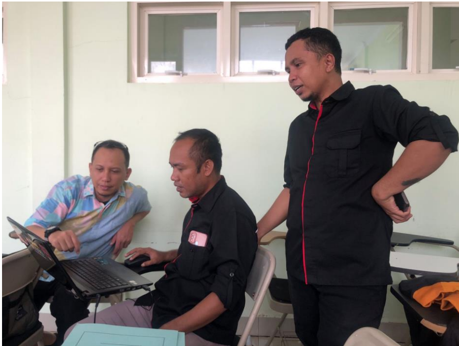
Gambar 5. Kegiatan pendampingan dalam workshop

Hasil kegiatan ini telah memberikan hasil yang signifikan kepada dosen Program Studi PSDP UM Buton sebagai sasaran dalam kegiatan ini, dimana terjadi peningkatan skor SINTA peserta. Sebelum workshop skor SINTA dosen Program Studi PSDP UM Buton adalah 85 untuk skor Overall dan 51 untuk skor 3Yr yang menempati posisi ke-15 di UM Buton, setelah pelaksanaan workshop meningkat menjadi 515 untuk skor Overall dan 345 untuk skor 3Yr yang juga naik posisi menjadi urutan ke-13. Adapun peningkatan skor SINTA masing-masing dosen dapat dilihat pada Gambar 6.