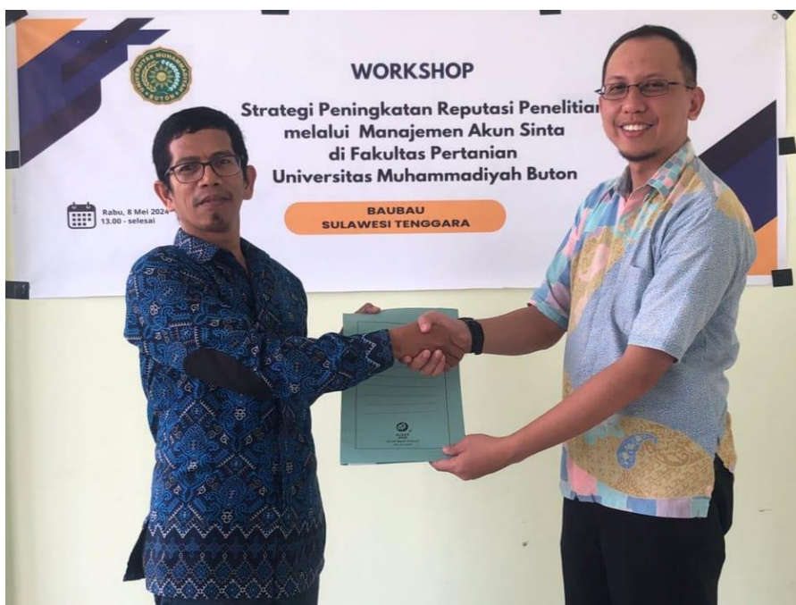
Gambar 3. Penyerahan sertifikat narasumber oleh Dekan