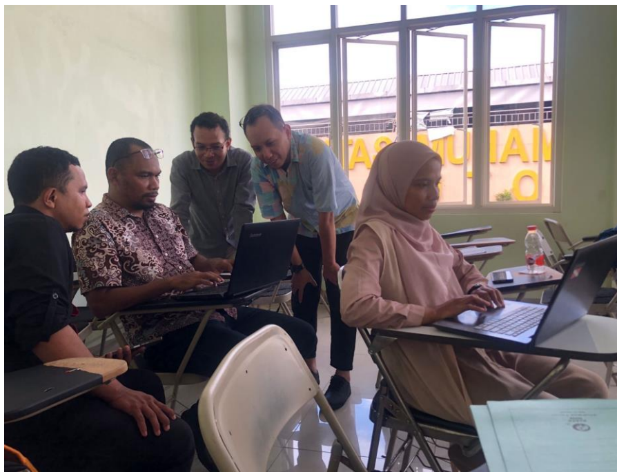
Gambar 2. Pendampingan manajemen akun SINTA oleh narasumber