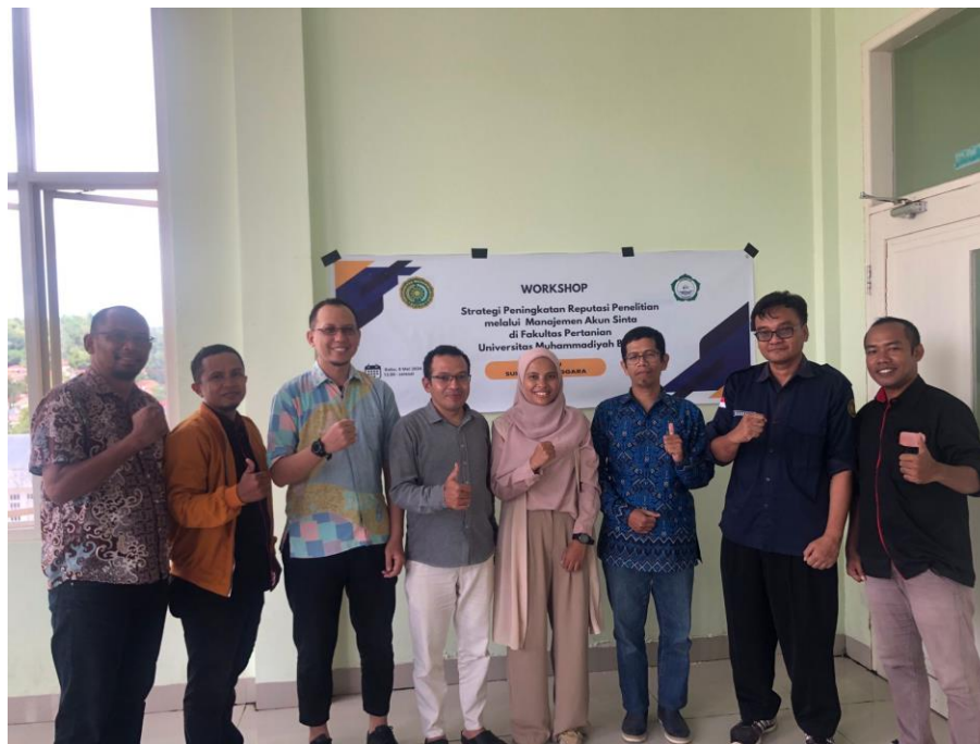
Gambar 4. Foto bersama di penutupan kegiatan workshop