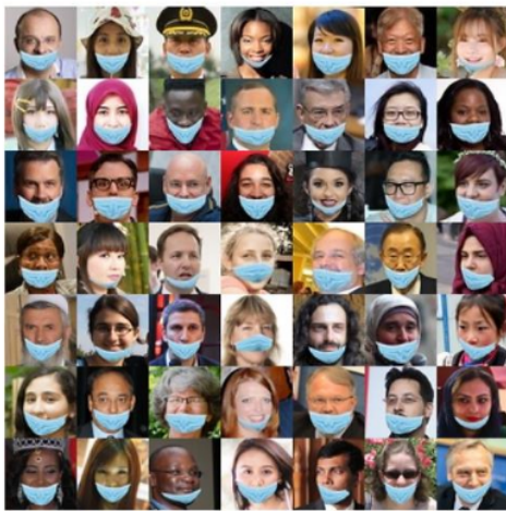
Gambar 2. Contoh dataset menggunakan masker namun tidak benar

Untuk dataset kategori pertama dan kedua kami menggunakan dataset maskedface net [12]. Terdapat total 132616 gambar yang terdiri dari, 67.193 gambar orang yang memakai masker dengan benar dan 69.823 gambar orang yang memakai masker namun tidak benar. Secara umum dataset ini memiliki berbagai foto orang dari jenis kelamin, etnik, warna kulit yang bervariasi. Keseluruhan dataset ini di-generate secara otomatis menggunakan program komputer. Gambar 2 menunjukkan contoh dari dataset untuk yang mengenakan masker tidak benar.