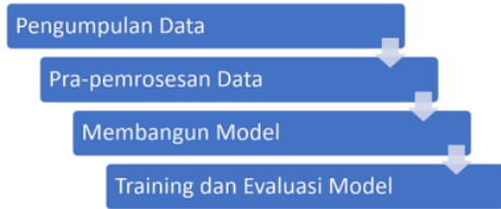
Gambar 1. Alur penelitian

antara lain: (1) pengumpulan data; (2) pra-pemrosesan data; (3) membangun model; (4) pelatihan dan evaluasi model. Gambar 1 menggambarkan alur dan temuan studi secara keseluruhan.