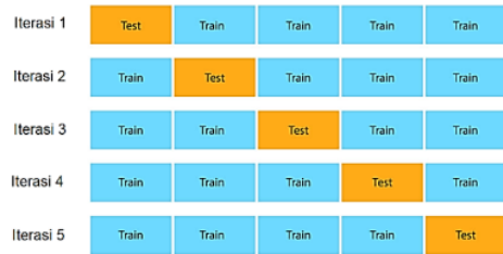
Gambar 3. Penerapan 5-fold validasi silang

validasi silang 5 kali lipat digunakan untuk memartisi data.