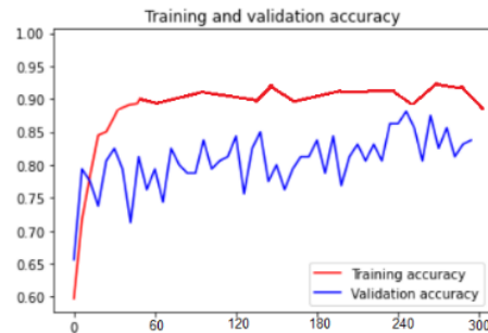
Gambar 6. Akurasi pada saat pelatihan dan validasi model

Strategi pengujian yang dilakukan melibatkan 3 pendekatan. Pendekatan pertama kami secara langsung mencatat hasil pelatihan dan validasi model tanpa melalui augmentasi gambar dan transfer learning . Dataset akan dibagi menjadi dua bagian: 80 persen akan digunakan untuk melatih model, sedangkan 20 persen sisanya akan menguji model tanpa menggunakan teknik validasi silang. Strategi pengujian kedua menggunakan augmentasi gambar sebelum model diuji. Adapun strategi pengujian ketiga menggunakan teknik deep transfer learning yang dijelaskan dalam sub-bab metodologi penelitian. Pendekatan ini diperlukan untuk menentukan seberapa jauh augmentasi gambar dan deep transfer learning meningkatkan kinerja. Gambar 6 menggambarkan akurasi pada saat pelatihan dan validasi.