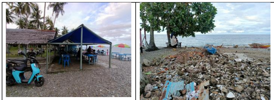
Gambar 2. Lingkungan Objek Wisata Pantai Wai Ipa

Bangunan warung masih berupa semi permanen dan terlihat kurang layak. Atap menggunakan daun sagu yang sudah mulai rusak, serta dinding kayu yang telah lapuk. Meja dan peralatan memasak masih terbuka sehingga berpotensi menjadi sumber pencemaran jika tidak dibersihkan secara rutin. Tempat sampah tersedia, namun tidak tertutup dan jumlahnya belum memadai. Oleh karena itu, diperlukan peningkatan sanitasi, penyediaan tempat sampah tertutup, serta renovasi bangunan agar lebih layak dan menarik bagi pengunjung.