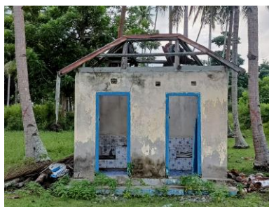
Gambar 3. Toilet di Objek Wisata Pantai Wai Ipa

Objek wisata ini belum memiliki fasilitas toilet yang memadai. Pengunjung yang membutuhkan harus menggunakan fasilitas milik warga sekitar. Terdapat bangunan toilet, namun kondisinya tidak layak digunakan dan terlihat jarang dirawat. Oleh sebab itu, diperlukan pembangunan toilet baru atau renovasi total agar dapat berfungsi dengan baik dan memenuhi standar kebersihan. Berisi bagaimana data dikumpulkan, sumber data dan cara analisis data serta pelaksanaan pengabdian masyarakat.