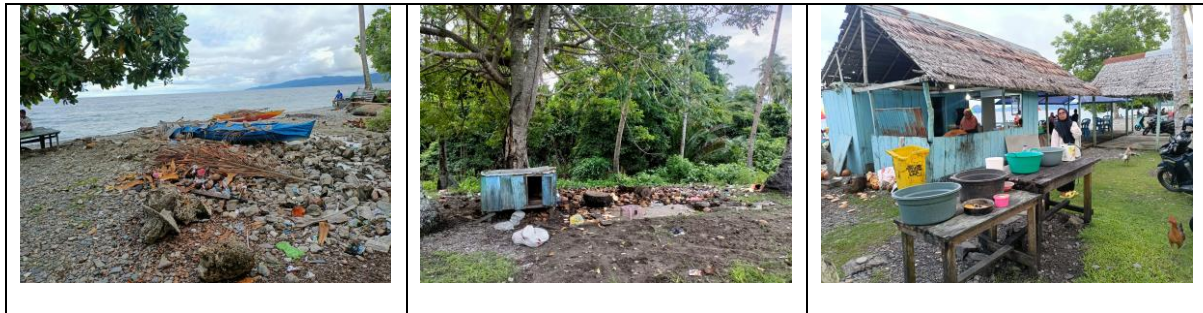
Gambar 1. Lingkungan Objek Wisata Pantai Wai Ipa

Berdasarkan hasil observasi, kondisi objek wisata Pantai Wai Ipa dapat dijelaskan sebagai berikut: