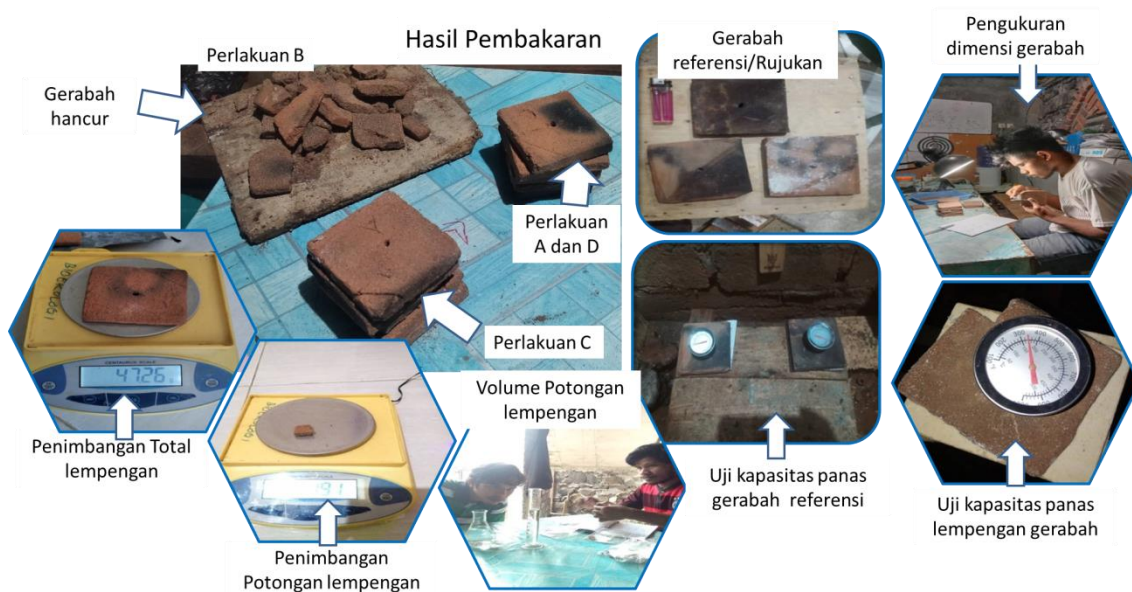
Gambar 4. Kondisi lempengan hasil pembakaran

Pengolahan pasir pantai dengan warna hitam keputih-putihan memnghasilkan ukuran butiran pasir yang relatif seragam (halus) dan makin minim butiran pasir dari pecahan karang dan cangkang molusca (Gambar 2). Hasil pengayakan pasir menunjukkan tekstur yang lebih padat saat basah dengan warna hitam dan saling terpisah (saling lepas) saat diremas. Karakteristik lainnya hasil pengolahan pasit memperlihatkan adanya kilauan cahaya saat terkena sinar matahari, kondisi tersebut menunjukkan bahwa pasir yang digunakan mengandung unsur kristal (silika).