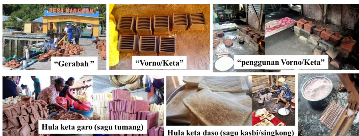
Gambar 1. Produk gerabah dari sentra gerabah Pulau Mare serta hasil pengolahan pangan tradisional yang dihasilkan

Pembuatan/pengolahan tanah liat menjadi gerabah telah lama dikenal oleh masyarakat di Indonesia, termasuk masyarakat Pulau Mare (Desa Maregam dan Desa Mare Kofo) di Wilayah Kota Tidore Kepulauan Provinsi Maluku Utara, aktifitas pengrajin gerabah di Pulau Mare merupakan satu-satunya sentra pembuatan gerabah di Maluku Utara (Kusrini 2020), dimana keberadaannya sudah ada sejak jaman kesultana Tidore. Proses pembuatan gerabah oleh masyarakat Pulau Mare khususnya Desa Maregam masih menggunakan teknologi sederhana (tradisional) serta mempertahankan produk gerabah dengan minim kreatifitas dan sentuhan teknologi (Kusrini 2020). Hal tersebut diperlihatkan pada. hasil olahan produk gerabah masih mempertahankan model dan bentuk/desain gerabah yang terdahulu (Mahmud 2013) serta masih menggunakan material tanah liat (lempung) dan pasir yang diperoleh disekitar perkampungan mereka.