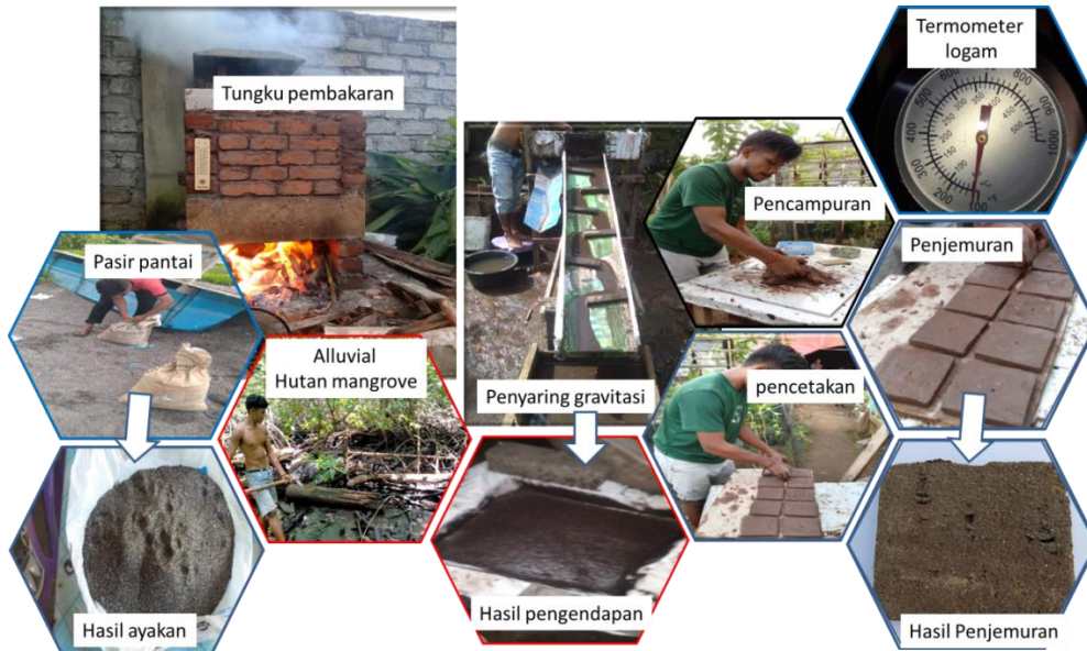
Gambar 2. Instrumrn yang digunakan dan proses pembuatan gerabah dari material alluvial hutan mangrove

konsumen (Sudana 2015, Jayadi et al. 2016, Akbar dan Prastawa. 2019) serta mendukung pertumbuhan industri pengolahan pangan di Maluku Utara.