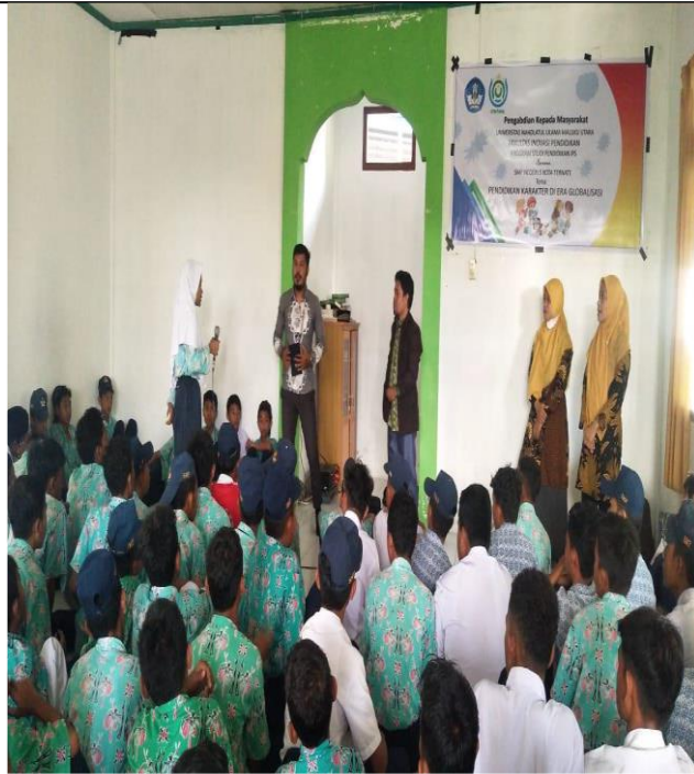
Gambar 6. Pemberian Materi Kepada Siswa/i