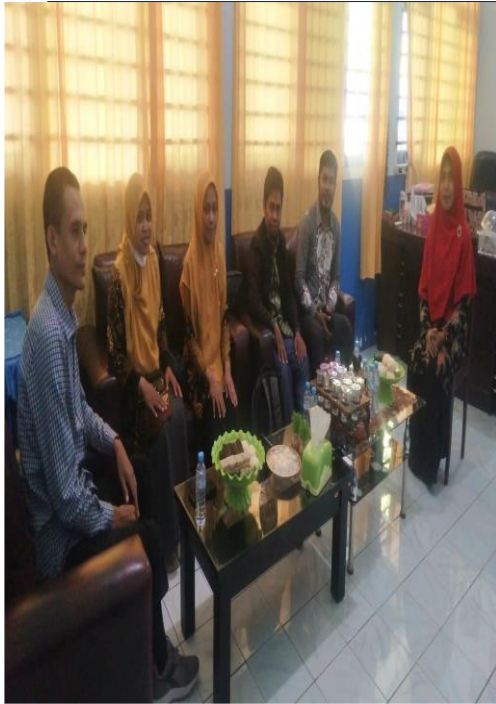
Gambar 5. Pertemuan dengan Kepsek