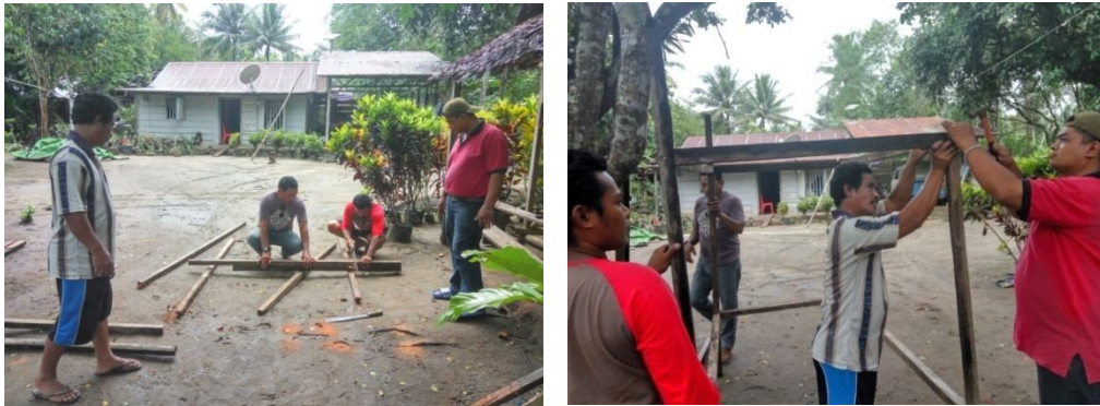
Gambar. 4. Proses Pembuatan Kandang Imago Hama sexava sp

penelitian sudah harus disiapkan kandang pemeliharaan imago sexava sp dan di ambil telurnya sebagai bahan perbanyakan parasit Leefmansia bicolor (Gambar 4).