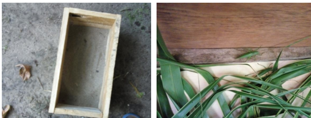
Gambar 8. Kandang Pemeliharaan dan tempat telur Hama Sexava sp

Imago hama Sexava sp yang telah ditangkap di lapangan akan dipelihara dalam kandang pemeliharaan agar imago hama Sexava sp betina dapat memproduksi telur yang akan di jadikan sebagai bahan perbanyakan dari parasit Leefmansia bicolor . Dalam kandang imago hama Sexava sp harus diberikan pakan daun kelapa atau daun pisang yang cukup segar dan harus sering diganti agar produksi telur Sexava sp dapat bertelur dalam jumlah yang banyak. Banyak sedikitnya Perbanyakan parasit Leefmansia bicolor tergantung dari jumlah telur yang diproduksi oleh imago hama Sexava sp , semakin banyak telur maka akan semakin banyak juga Leefmansia bicolor yang dapat dikembangkan melalui proses infeksi (Gambar 8).