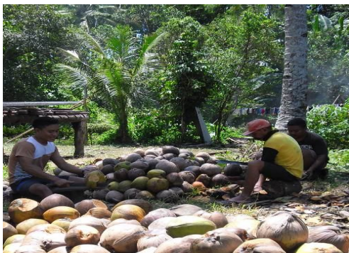
A. Pembuatan kopra

Kelompok tani Jobubu merupakan kelompok tani yang selain memanfaatkan buah kelapa untuk dibuat kopra, sekarang ini juga bergerak dalam bidang pembibitan tanaman kelapa dan menjadi salah satu penyedia bibit tanaman kelapa untuk mencukupi kebutuhan peremajaan tanaman kelapa di Kabupaten Halmahera utara (Gambar 3). Permasalahan prioritas yang dihadapi Kelompok Tani Mulaman Jaya dan Kelompok Tani Jobubu adalah sebagai berikut : Keterbatasan pengetahuan kelompok tani tentang bahaya pemakaian pestisida berbahaya kimia, Keterbatasan pengetahuan dan ketrampilan kelompok tani tentang cara dan teknik pengendalian secara biologi, Keterbatasan pengetahuan dan ketrampilan kelompok tani tentang cara dan teknik mengisolasi dan memperbanyak Leefmansia bicolor , Kurangnya pendampingan yang dilakukan oleh dinas terkait kepada kelompok tani dalam hal pengendalian hama sexava sp yang ramah lingkungan, serta Kurangnya pengetahuan kedua kelompok tani tentang keuntungan secara ekonomi dengan penggunaan pengendalian secara biologi atau alamiah dibandingkan cara pengendalian secara kimia.