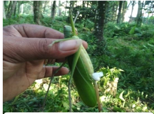
B. Imago Hama Sexava sp