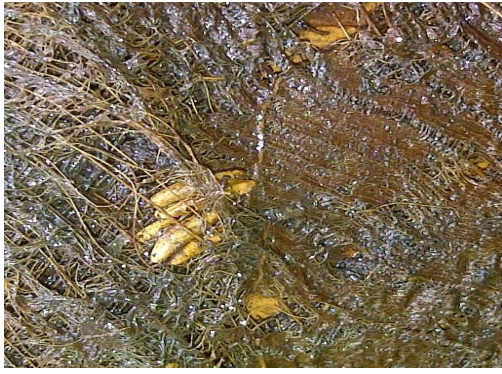
A. Telur Hama Sexava sp