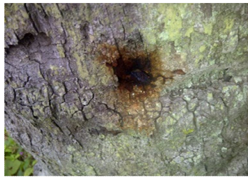
B. Penggunaan Pestisida Kimia