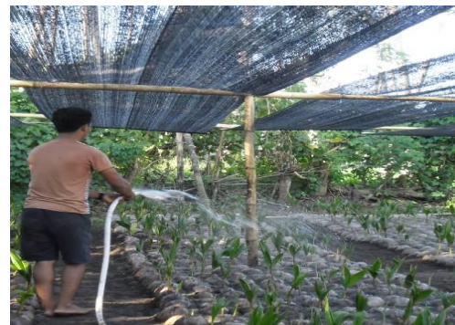
B. Pembibitan kelapa