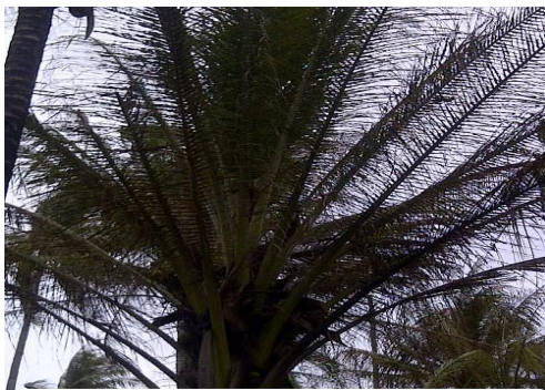
A. Gejala Serangan Hama

Desa Daru merupakan salah satu Desa yang berada di wilayah Kecamatan Kao Utara, Kabupaten Halmahera Utara, dengan jarak kurang lebih 60 km dari pusat kota Tobelo. Desa Daru mempunyai wilayah desa kurang lebih 20 ha, dan sebagian besar wilayah tersebut merupakan wilayah pertanian perkebunan kelapa. Sejak tahun 2011 sudah terbentuk 2 kelompok tani yaitu kelompok tani Mulaman Jaya dan Kelompok Tani Jobubu. Dari informasi anggota kedua kelompok tani tersebut telah banyak tanaman yang terserang berbagai hama tanaman kelapa, yang salah satunya adalah hama sexava sp (Gambar 1).