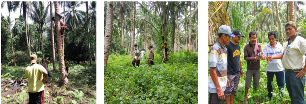
Gambar 6. Proses Pengumpulan imago Hama Sexava sp

Pengumpulan imago hama Sexava sp dilakukan pada pagi hari untuk pohon kelapa yang masih pendek kurang lebih sebelum jam 09.00 WIT karena bila lebih dari jam tersebut maka imago hama Sexava sp akan bersembunyi di dalam pelepah daun kelapa sehingga imago sulit untuk dilihat apalagi ditangkap. Hama Sexava sp merupakan hama yang mempunyai kebiasaan keluar untuk mencari makan dan kawin pada malam hari sedangkan pada siang hari bersembunyi di balik pelepah daun kelapa sehingga sulit untuk ditemukan. Untuk kelapa yang sudah tinggi penangkapan hama Sexava sp dapat dilakukan pada saat kelapa tersebut dipanen, aktivitas pemanenan buah kelapa dapat mengganggu imago hama Sexava sp sehingga kebanyakan akan terbang kebawah dan disaat bersamaan imago hama Sexava sp dapat ditangkap (Gambar 6).