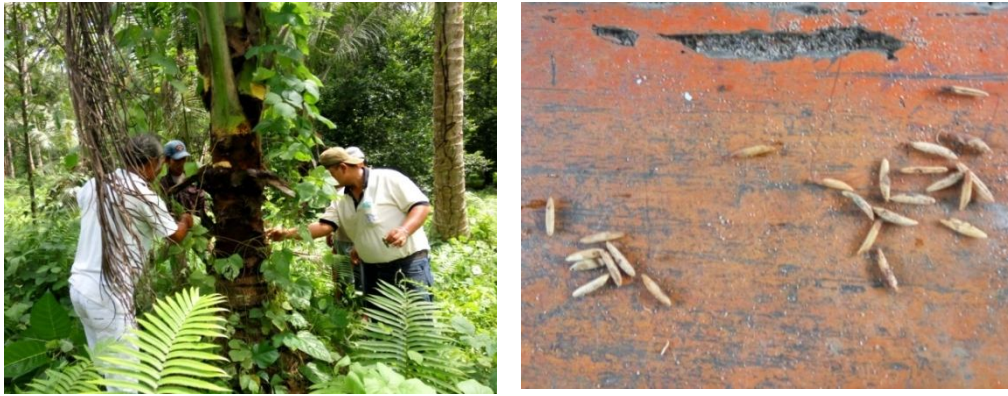
Gambar 7. Pengumpulan telur Sexava sp yang terinfeksi parasit Leefmansia Bicolor