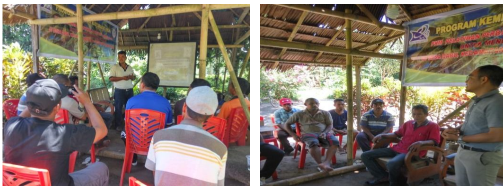
Gambar. 5. Pemberian materi pada saat pelatihan

Pelaksanaan pelatihan dilakukan selama kurang lebih satu hari yang dilakukan di tempat ketua kelompok tani Jobubu. Pelatihan diawali dengan pemberian materi presentasi mengenai bahaya penggunaan pertisida kimia secara berlebihan pada tanaman kelapa dan materi Pelatihan mengenai Leefmansia bicolor . Pada materi mengenai Materi Leefmansia bicolor ini berisikan cara mendapatkan musuh alami leefmansia bicolor , serta bagaimana teknik mendapatkan imago Sexava sp di lahan perkebunan kelapa (Gambar 5).