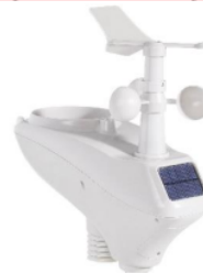
Gambar 2. Automatic Weather Station

Automatic Weather Station (AWS) adalah sebuah stasiun cuaca otomatis yang dengan kemampuan monitoring kondisi cuaca luar ruangan dan dalam ruangan. Parameter-parameter cuaca yang dapat diukur diantaranya adalah suhu, kelembaban, radiasi UV, dan radiasi matahari. Hasil monitoring cuaca tersebut terhubung ke website secara real time. AWS dipasang di lokasi pengukuran sebagai alat ukur cuaca sekitar pada DAST. AWS yang digunakan pada penelitian ini ditunjukkan pada Gambar 2.