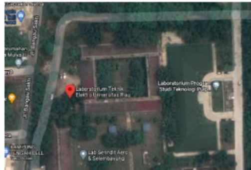
Gambar 3. Lokasi Penelitian

Penelitian ini dilaksanakan pada bulan desember 2020. Pengambilan data pengaruh cuaca menggunakan AWS terhadap produksi energi pada DAST dilakukan selama 5 hari. Lokasi pengambilan data terletak di Laboratorium Teknik Elektro Fakultas Teknik Universitas Riau [9]. Secara letak geografisnya, penelitian ini berposisi pada garis lintang utara 0.4821799292432583°U dan pada garis bujur timur 101.37658960651271°T seperti yang terlihat pada Gambar 3.