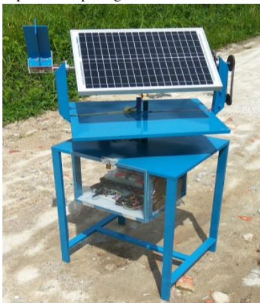
Gambar 1. PLTS Dual Axis Sun Tracker

PLTS Dual Axis Sun Tracker (DAST) adalah pembangkit listrik tenaga surya dengan menggunakan sistem tracking sesuai dengan arah sumber cahaya. DAST memiliki 2 sumbu penggerak vertikal dan horizontal. Dengan adanya 2 sumbu penggerak tersebut, DAST mampu mengikuti perubahan posisi matahari mulai dari terbit pagi hari hingga terbenam pada sore hari [7]. Posisi panel surya yang selalu tegak lurus dengan matahari menghasilkan produksi energi pada DAST lebih baik dari PLTS tanpa menggunakan tracking. Namun fluktuasi produksi energi pada DAST sangat dipengaruhi oleh kondisi cuaca sekitar [8]. Bentuk PLTS Dual Axis Sun Tracker dapat dilihat pada gambar 1.