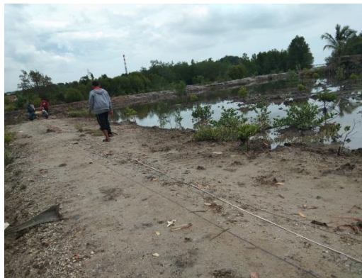
Gambar 2. Lintasan dengan Metoda Schlumberger

Dalam melakukan eksplorasi tahanan jenis (resistivitas) diperlukan pengetahuan rencana perbandingan posisi titik pengamatan terhadap sumber arus. Perbedaan letak titik tersebut akan mempengaruhi besar medan listrik yang akan diukur. Besaran koreksi terhadap perbedaan letak titik pengamatan tersebut dinamakan faktor geometri. Faktor geometri diturunkan dari beda potensial yang terjadi antara elektroda potensial MN yang diakibatkan oleh injeksi arus pada elektroda arus AB.