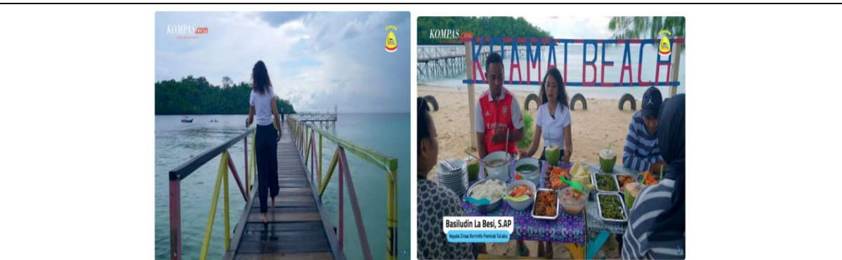
Gambar 2. Fasilitas Wisata

Gambar tersebut secara keseluruhan menggambarkan daya tarik dan suasana wisata Kramat Beach dalam berbagai waktu dan sudut pandang. Wisatawan tampak menikmati fasilitas wisata sambil menyaksikan panorama laut dan pulau-pulau di sekitarnya, baik pada siang, sore, maupun malam hari. Aktivitas wisata tidak hanya berfokus pada keindahan alam seperti pasir putih dan pemandangan pesisir, tetapi juga pada pengalaman kuliner khas lokal, seperti pisang goreng dan air saraba yang dinikmati pada suasana sore hingga malam. Selain itu, keindahan Kramat Beach ditampilkan melalui atraksi alam pada pagi dan siang hari yang menonjolkan hamparan pasir putih yang bersih dan menawan. Keseluruhan gambaran tersebut dilengkapi dengan peta Desa Kramat hasil pengambilan udara menggunakan drone, yang memberikan konteks spasial lokasi destinasi wisata secara menyeluruh.