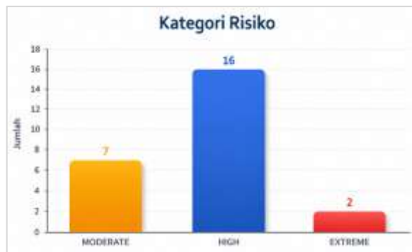
Gambar 2.1 Kategori Risiko

Perhitungan indeks risiko dilakukan dengan mengalikan nilai likelihood dan severity berdasarkan standar AS/NZS 4360. Hasil analisis menunjukkan variasi tingkat risiko yang terdiri dari: risiko rendah, risiko sedang, risiko tinggi, risiko ekstrim. Adapun sebaran kategori risiko sebagai berikut :