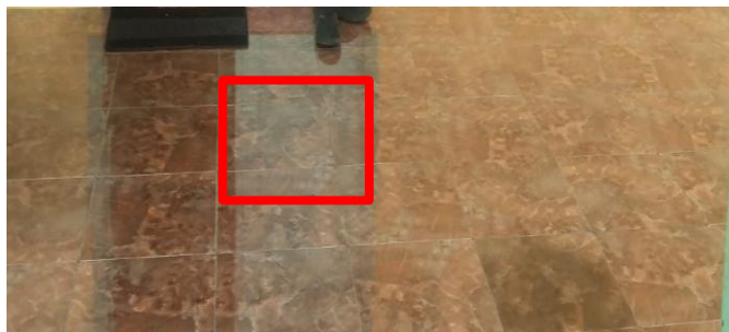
Gambar 4. Lantai Rumah Adat

Fandasi teras rumah adat Fala Soa Togolobe di pandang dari depan berbentuk Trapesium segi empat yang memiliki tepat satu pasang sisi yang sejajar. Trapesium adalah bangun datar dua dimensi yang dibentuk oleh empat buah rusuk yang dua di antaranya saling sejajar namun tidak sama panjang. Makna filosofi dari bentuk pada rumah ini merupakan dasar utama dari suatu bangunan yang berfungsi sebagai batasan dan merupakan dasar pijakan atau pegangan pada setiap pengambilan keputusan harus berdarkan pimpinan tertinggi.