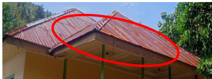
Gambar 1. Atap Rumah Adat Berbentuk Limas

Atap rumah adat berbentuk Limas segi empat yang merupakan bangun ruang sisi datar yang tersusun atas sebuah alas berbentuk segi-n dengan sisi tegak berbentuk segi tiga yang saling bertemu di satu titik atas. Atap rumah Fala Soa Togolobe berbentuk limas segi empat bersusun karena menganut prinsip cosmos epic (hasil karya yang beraturan) yang terbagi atas dua bagian, yaitu badan rumah ( badan fala ) dan atap rumah ( fala ma seng ) Atap yang bersusun dua dinamakan ( rete romdidi ) yang menandakan bahwa itu merupakan rumah adat Fala Soa Togolobe dan mempunyai filosofi mengayomi masyarakat atau keluarga -keluarga yang melaksanakan ritual adat di rumah tersebut. Selain itu atap rumah adat Fala Soa Togolobe juga memiliki makna bahwa ketua adat yang meninggal rumah tersebut mengayomi masyarakatnya sehingga tercipta suatu kesatuan. Konsep bentuk pada atap itu sendiri agar air hujan tidak bisa masuk dalam rumah dan angin tidak mudah merobohkan.