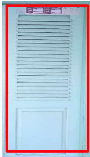
Gambar 5. Daun Pintu Rumah Adat

Daun pintu rumah adat Fala Soa Togolobe berbentuk persegi panjang yang mempunyai 2 pasang sisi sejajar yang sama panjang, dan mempunyai 4 titik sudut siku-siku. Persegi panjang adalah gabungan dari 2 atau lebih persegi yang memanjang. Sisi yang panjang di namakan panjang ( p ) dan sisi yang pendek di namakan ( l )