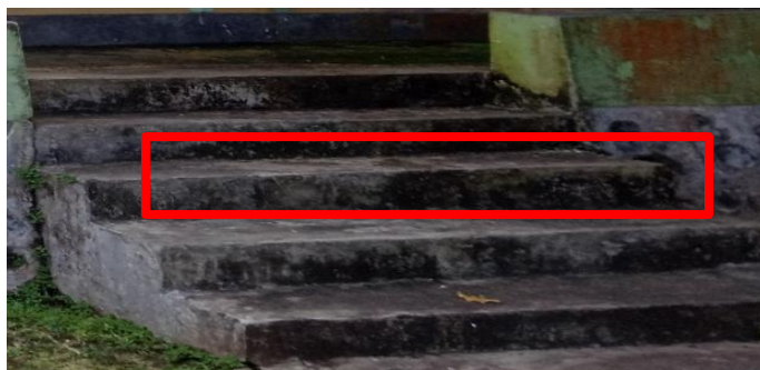
Gambar 4.16 Tangga Rumah Adat

Tangga rumah adat Fala Soa Togolobe berbentuk persegi panjang, Tangga rumah adat Fala Soa Togolobe bermakna sebagai pembatas antara tamu dan tuan rumah dengan maksud tamu yang bukan muhrim tidak diperkenankan langsung bertemu tuan rumah. Sementara itu, anak tangga pada rumah ini berjumlah ganjil menjadikan suatu kekhasan filosofi religius. Pintu tangga yang lebih rendah daripada tinggi orang dewasa memiliki filosofi tamu yang berkunjung menghormati tuan rumah. Aspek kedua mengenai tangga di rumah adat Fala Soa Togolobe yang rata-rata berjumlah ganjil. Pemuatan gambar dapat dilihat pada gambar di atas . Pada umumnya, anak tangganya berjumlah 5, 7, 9, dan seterusnya. Bilangan ganjil ini memiliki filosofi tersendiri bagi masyarakat setempat. Masyarakat kelurahan Togolobe menganggap bilangan ganjil adalah bilangan yang unik dan sulit untuk ditebak. Selain itu, adanya kekhasan yang bersifat religius.